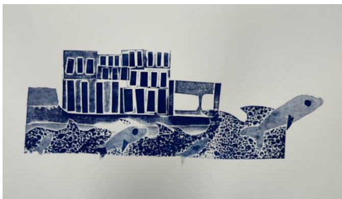
Špela Ponudič, 6. a (šolsko leto 2023/24)