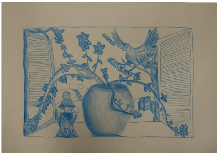
Amina Bećirović, 8. c (šolsko leto 2023/24)